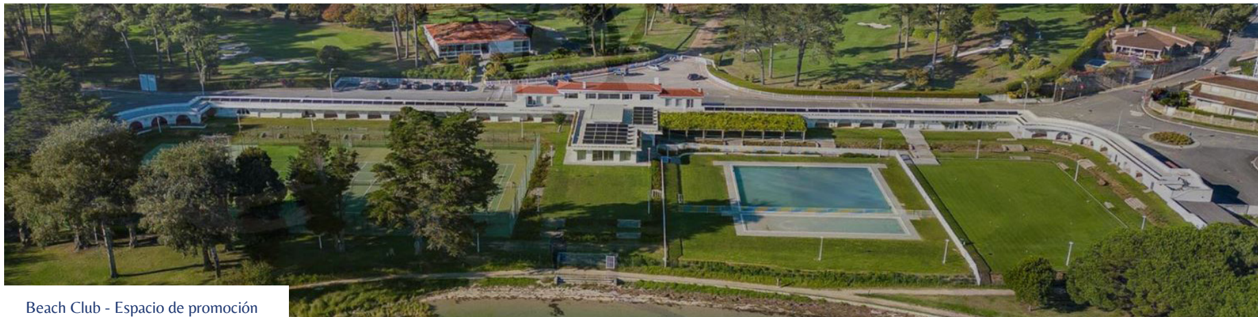
Beach Club - Espacio de promoción