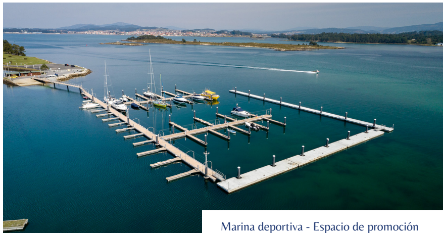
Marina deportiva - Espacio de promoción

“Un entorno idílico, un marco incomparable”